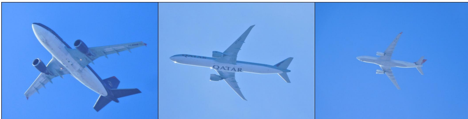
luchtverkeer boven het Nationaal Landschap Zuid-Limburg