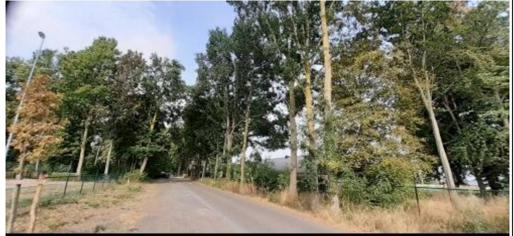
Bomenkap Cadier en keer

Bomenkap Cadier en Keer, voorkomen kap De Kleine Peul, voorkomen activiteiten in stiltegebied bij Raad van State Buitengewoon Buitengebied, werktafels omgevingsvisie Verdozing van het landschap, meerdere megaloodsen Zonnepark Eijsden, oplossen parkeerprobleem onder zonnecellen Belijning fietspad Cadier en Keer naar Margraten, veiligheid fietsers Gebiedsvisie Midenterras Bemelen-Mesch, betrokken. Onderzoek ruimtelijke plannen, geen vervolg nodig