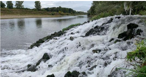
Samen met XR worden de zorgen over de lozingen door Chemelot serieus genomen.

Ook met algemeen bestuurders WL hebben we goede contacten. Hierbij vinden we vooral gehoor bij de Algemene Water Partij waarmee we regelmatig overleg hebben. Het is de enige partij die ons serieus neemt als we vragen hebben. Ook vond er overleg plaats met de fractie van de Partij voor de Dieren.