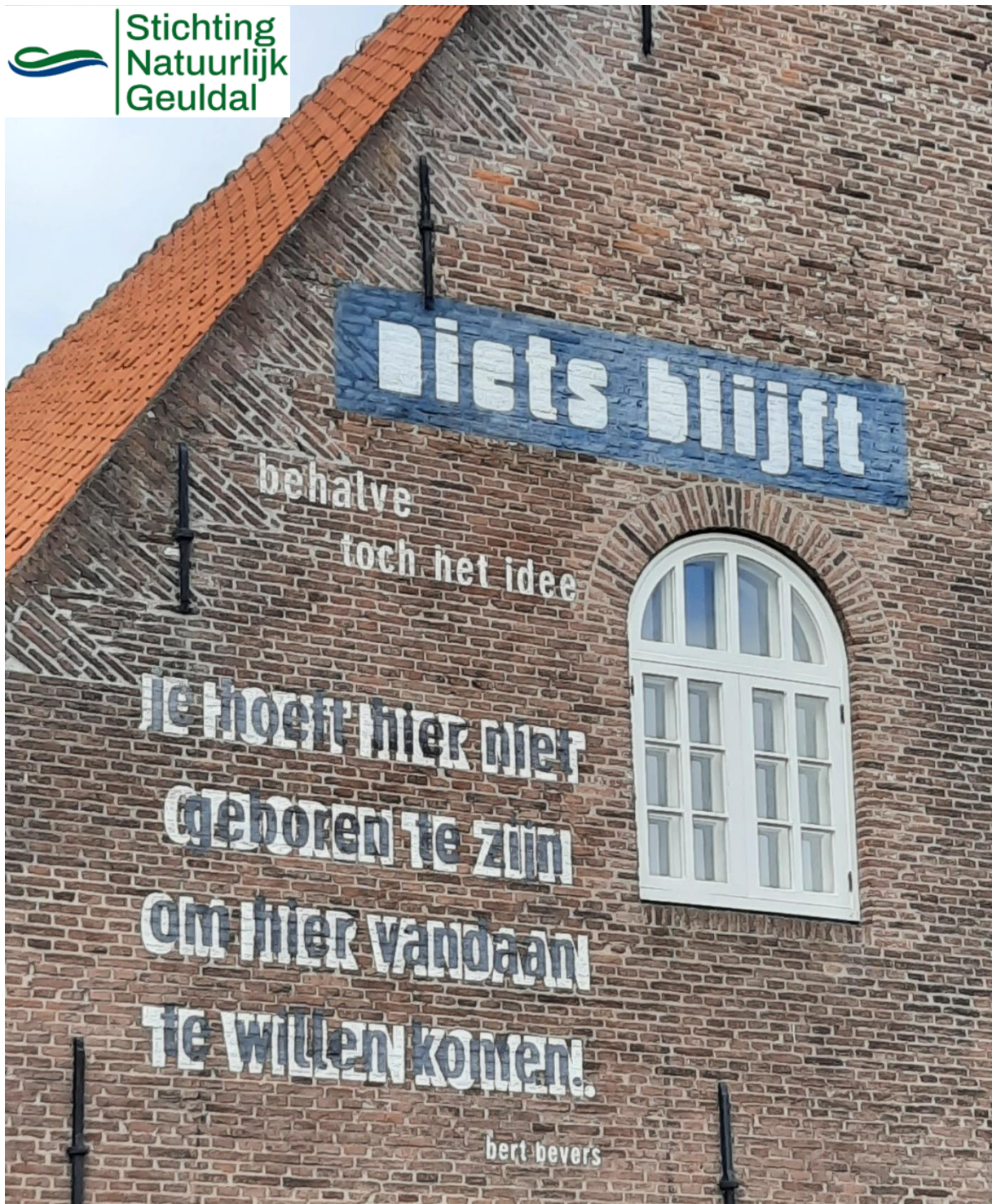
De blokstallen in Bergen op Zoom met op de gevel een gedicht van bert bevers