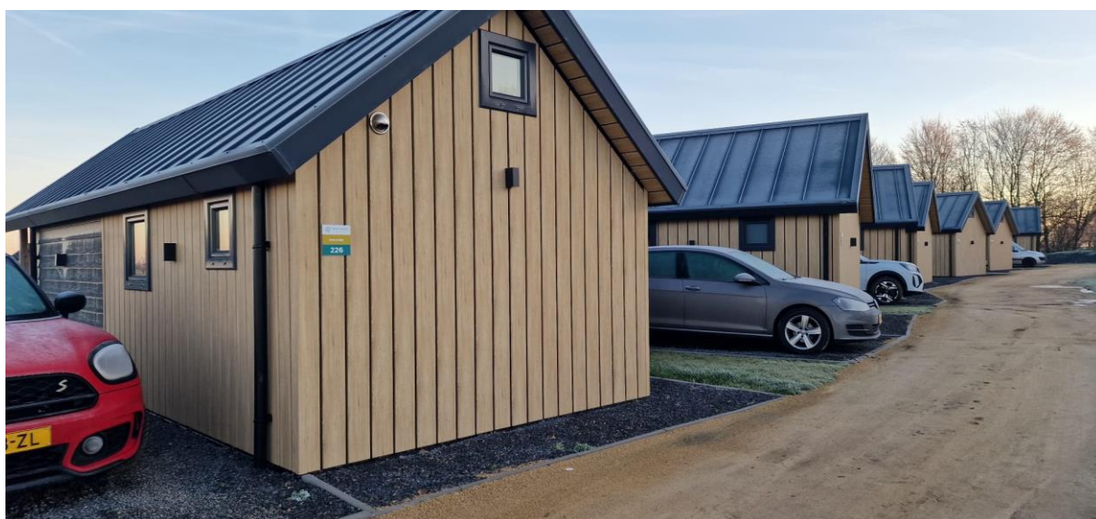
Voorbeeld van een huisjespark