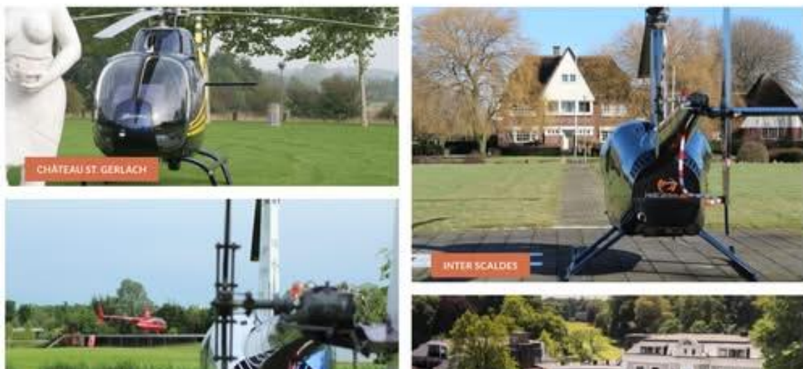
Willekeurige foto's van helikopters

Hier volgen enkele voorbeelden van restaurants met heliport: