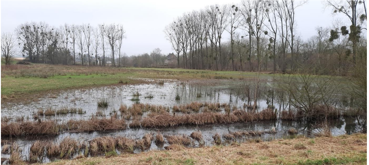
De plek naast de Wittemer Allee waar de fietsverbinding zou moeten komen!