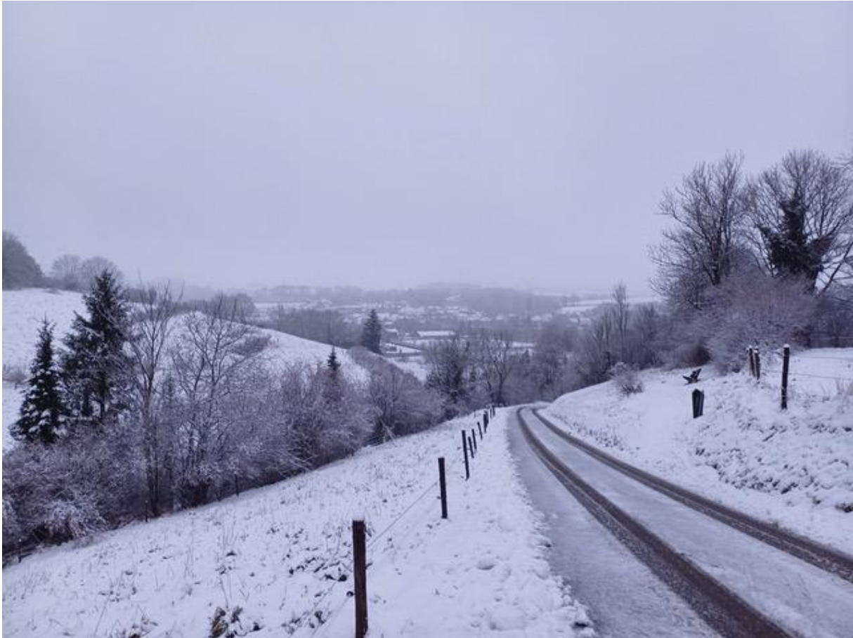
Zicht op Schin op Geul vanaf de Keutenberg

Hier op de Keutenberg vergadert het bestuur van Stichting Natuurlijk Geuldal 4 maal per jaar. Daarnaast vinden er verschillende ad hoc bijeenkomsten plaats met andere organisaties of is er telefonisch of per mail overleg.