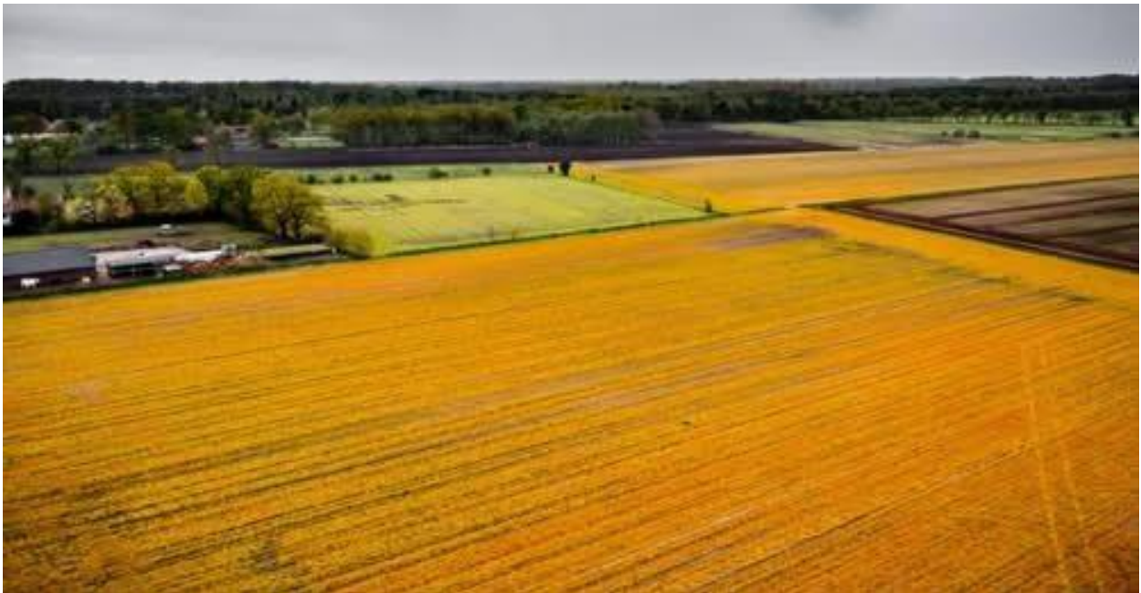
Met glyphosaat bespoten landbouwgrond.

De Glyphosaat problematiek zal ook in 2025 spelen, tenzij de gemeentes ruime spuitcirkels gaan instellen. Daar gaan we voorstellen voor doen, maar ook actie voeren tegen de toepassing van dat gif. Het gebruik van Glyphosaat is omstreden en kan gezondheidsproblemen opleveren bij mensen. Het tast het bodemleven aan. Kortom: Glyphosaat is giftig voor mens en dier.