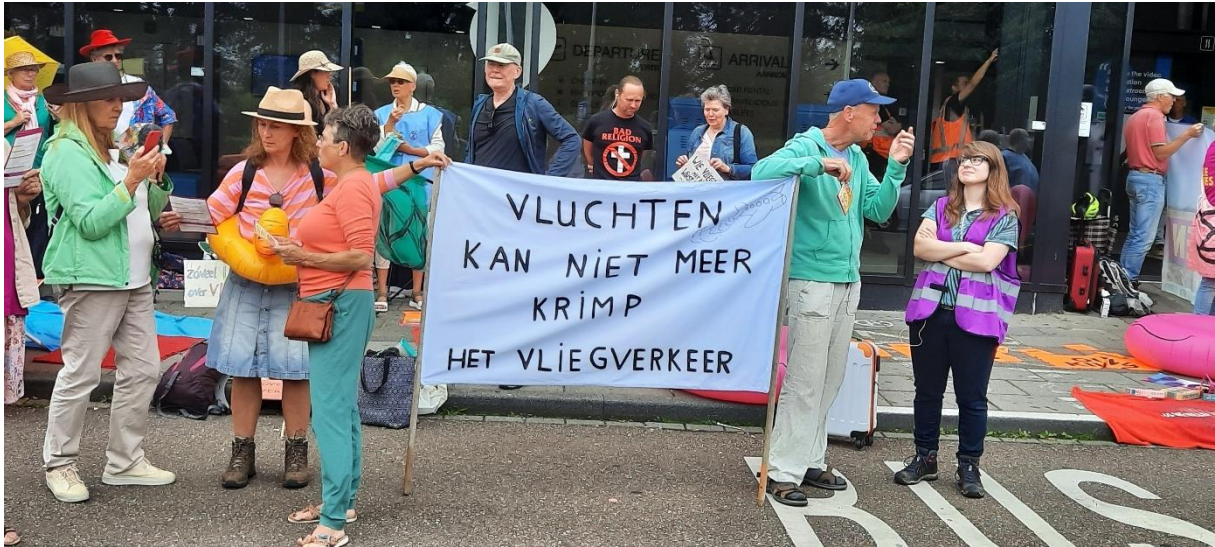
27 juli 2024, ludieke actie bij vliegveld Beek

Maar ook bij andere acties van XR, zoals het gebruik van Beaumix onder de A2 en vervuiling van de Ur en Maas door Chemelot, is SNG aanwezig.